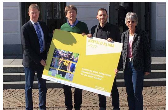
IKSK Stadt Krefeld - Energiebilanz 2017 Datenaufbereitung